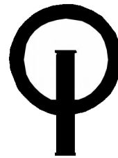
Zeil teken Optimist